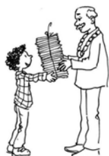
Durf jij het?

Week 38: 17 t/m 23 september thema: Durf jij het?