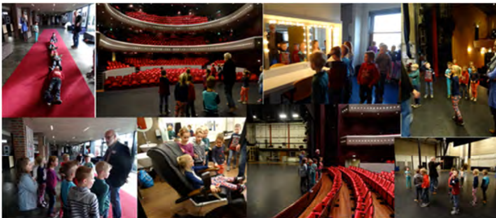
Rondleiding groep 3 in theater de Tamboer