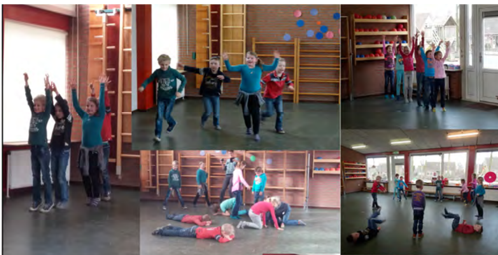
Voorstelling groep 3 De kermis