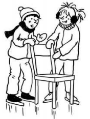
Als u het zegt...

Simon heeft de hele nacht gevisst, maar niets gevangen. Het heeft niet zoveel zin om het nog een keer te proberen; maar als Jezus het zegt... dan gebeuren er bijzondere dingen. Dat ervaart ook een verlamde man, die door zijn vier vrienden bij Jezus wordt gebracht.