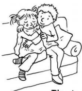
Ik zie tranen

Op weg naar Pasen ontmoet Jezus verschillende mensen. Hij neemt hen mee, op de weg die God wijst. Dat verandert hun leven. God maakt een nieuw begin: tranen veranderen in een lach, pijn maakt plaats voor geluk.